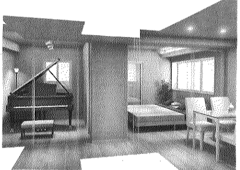
▲ミュージックマンションの内装イメージ

他にも、音楽に関係なく、動画撮影や配信を行う環境を求めて入居を決めた人もおられるという。